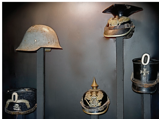
Casques Allemands - 1914 à 1918

Renseignements - 04 70 43 99 75 musee.souvigny@wanadoo.fr