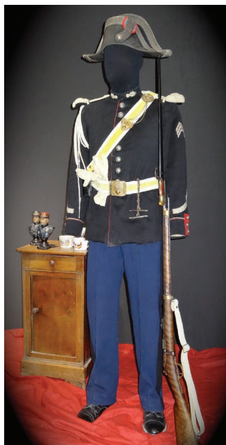
Gendarme - IIIe république

Cette exposition, à travers une scénographie originale, s'appuie sur de nombreux objets. Ainsi, de nombreux visuels d'époque, des documents d'archives, des témoignages inédits, une vingtaine d'uniformes et des vidéos d'archives offrent au visiteur une véritable immersion au coeur du conflit.