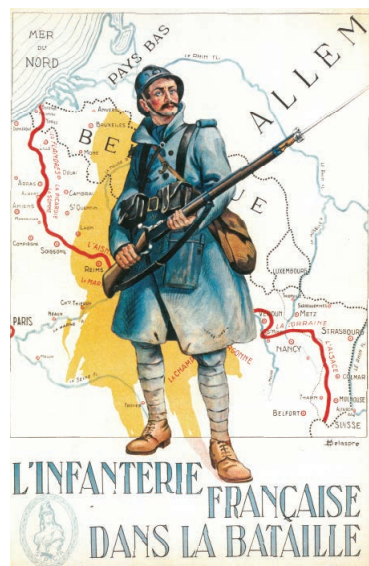
Affiche de propagande française