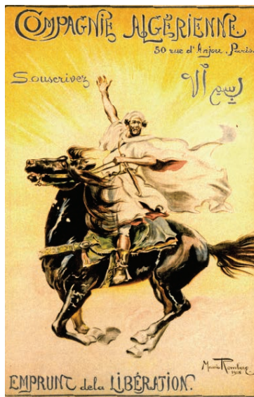
Affiche emprunt national - 1918