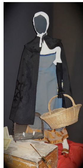
Tenue Bourbonnaise - XX ème