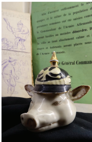
Pot à moutarde satirique