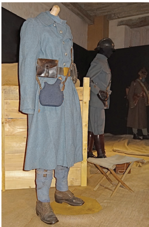
Uniforme de soldat d'infanterie - 1916

Dans une galerie divisée en cinq espaces, c'est une mosaïque de souvenirs qui témoignent et retracent l'histoire de cette guerre.