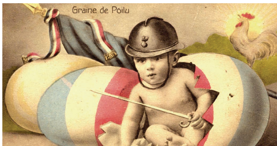
Affiche de propagande française