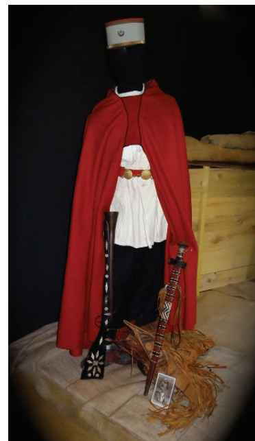
Adjudant méhariste - Début XX ème