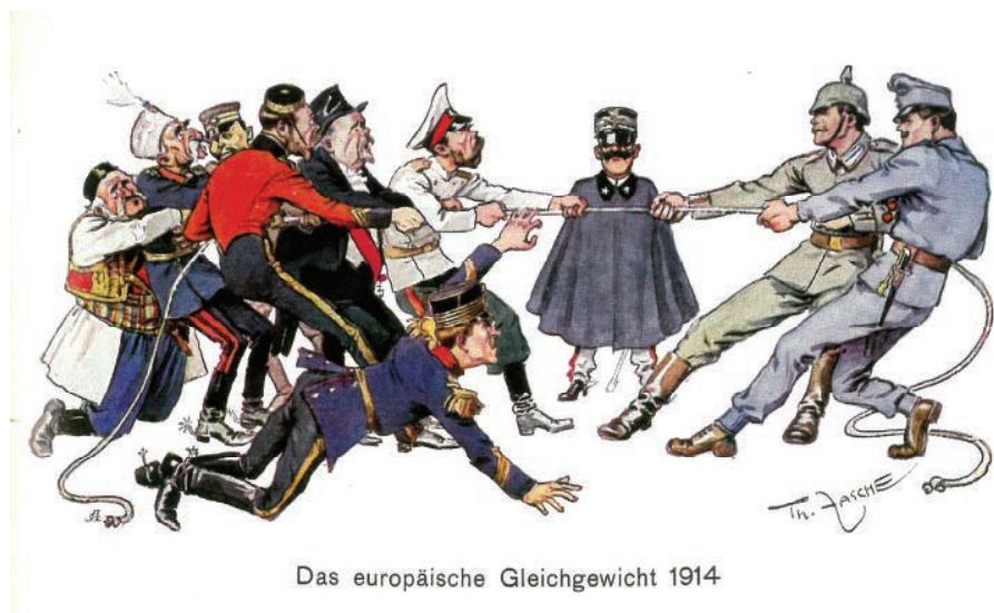
Das europäische Gleichgewicht 1914